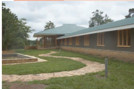
Das neue Kinderhaus in der Nähe von Kampala bietet Platz für über 100 Kinder.

Kampala liegt. Zur Zeit leben in dieser Zufluchtsstätte über 100 Kinder, und es kommt durchschnittlich ein neues Kind pro Monat dazu. Auf dem Gelände gibt es eine Schule und eine Krankenstation, die auch von den Bewohnern aus der Umgebung des Kinderhauses genutzt werden. Die älteren Kinder leben in kleinen Familiengruppen.