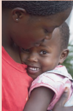
Außer Nahrung und Körperpflege bekommen die Kinder hier vor allem viel Liebe und Zuwendung.

Kampala liegt. Zur Zeit leben in dieser Zufluchtsstätte über 100 Kinder, und es kommt durchschnittlich ein neues Kind pro Monat dazu. Auf dem Gelände gibt es eine Schule und eine Krankenstation, die auch von den Bewohnern aus der Umgebung des Kinderhauses genutzt werden. Die älteren Kinder leben in kleinen Familiengruppen.